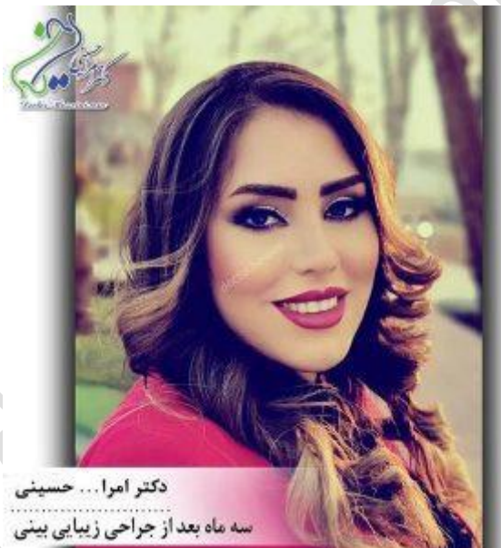
دکتر امرا... حسینی سه ماه بعد از جراحی زیبایی بینی

یکی از گزینه های خوب در بین جراحان بینی تهران، دکتر امرا... حسینی می باشد که از تجربیات و اطلاعات بسیاری در این زمینه بهره مند است. پیشینه آموزشی و علمی دکتر در طی دوران دراز تحصیل همیشه نشان دهنده تلاش با کیفیت ممتاز در سطح مدارس و دانشگاه های تراز اول کشور با رتبه های عالی بوده است و طی بیش از ده سال تجربه درخشان هزاران جراحی موفق را پشت سر گذاشته است.